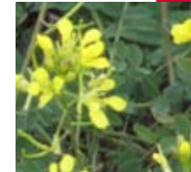
RAVENISSA GROGA (Erucastrum nasturtiifolium)