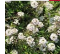
CAPS BLANCS (Lobularia maritima)