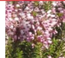
BRUC D'HIVERN (Erica multiflora)

*Per utilitzar les barbaoces, cal demanar prèviament permís a l'Ajuntament d'Olldola.