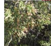
SAVINA MEDITERRÀNIA (Juniperus phoenicea)